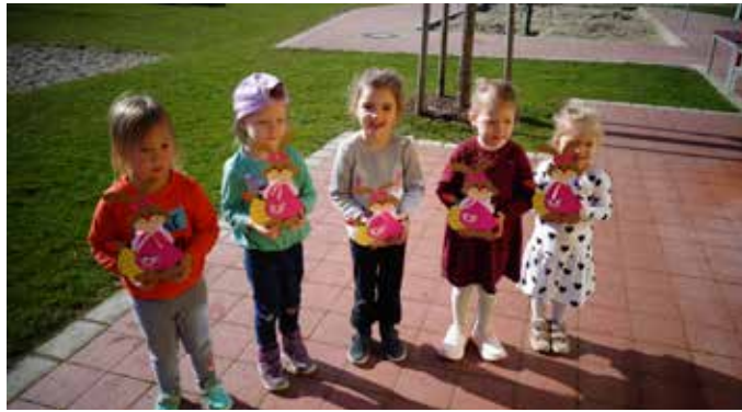
Danke, lieber Osterhase!