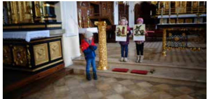
Seht das Zeichen, seht das Kreuz, es bedeutet Leben...