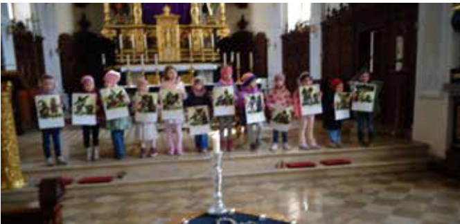
Anhand der Bildtafeln betrachten wir die 14 Stationen.

Musik hören, schauen wir ehrfürchtig auf die Bilder, die den Leidensweg von Jesus darstellen. Für einige von uns ist das sehr spannend, andere werden ganz still, weil die Geschichte traurig und gleichzeitig sehr real ist. Zu dieser besonderen Stunde singen wir gemeinsam Lieder und zünden Kerzen an. Am 27. März ist es dann endlich soweit! Unsere große Osterfeier in der Kita findet statt. Nach einem gemeinsamen Osterfrühstück machen wir uns voller Vorfreude auf die Suche nach den versteckten Osternestern im Garten. Es ist lustig zu entdecken, wie die Nestchen hinter Büschen und unter Bänken versteckt sind. Mit strahlenden Gesichtern tragen wir am Ende des Tages unsere gefundenen Schätze stolz nach Hause und freuen uns schon jetzt auf das nächste Erlebnis im Frühling.