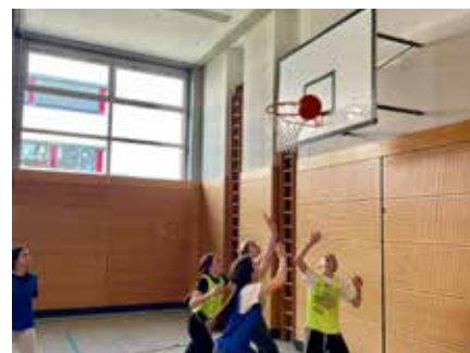
Geht er rein?