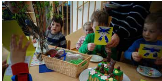
Es schmeckt ausgezeichnet und besonders lecker!