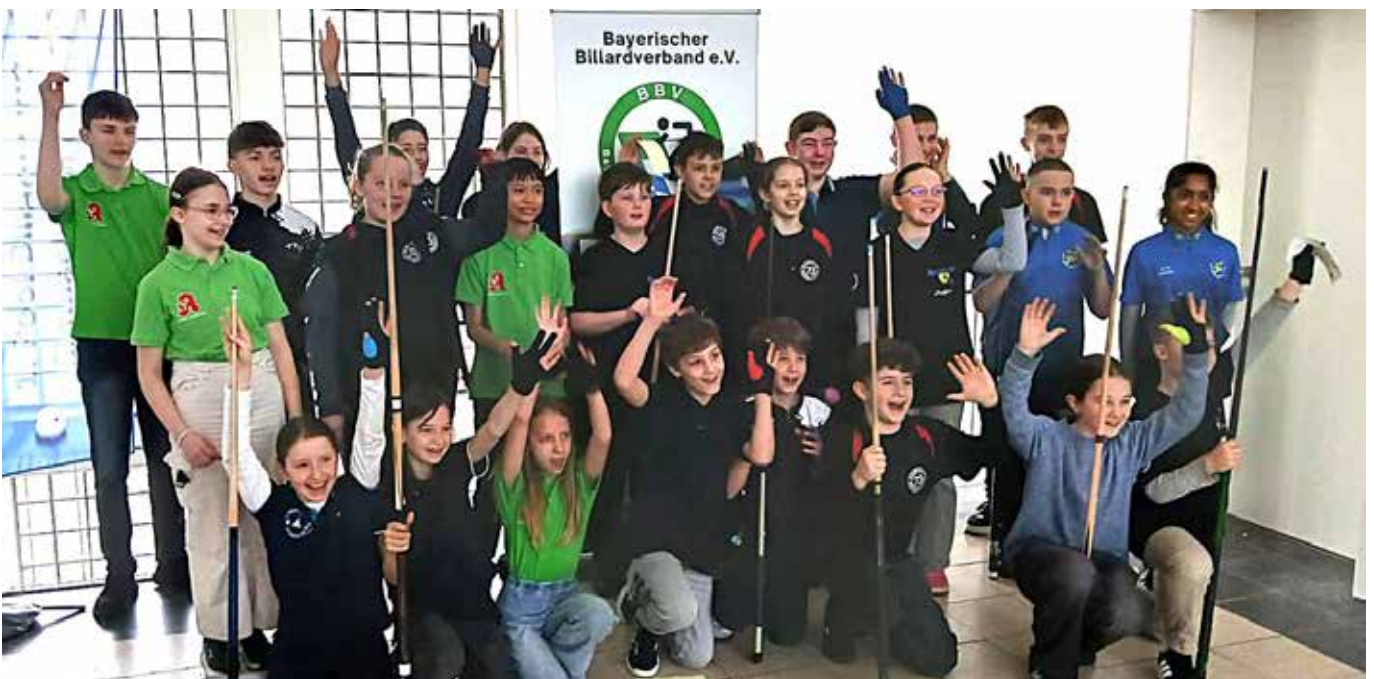
1. Spieltag in der neuen Jugendliga in Simbach mit den beteiligten Vereinen