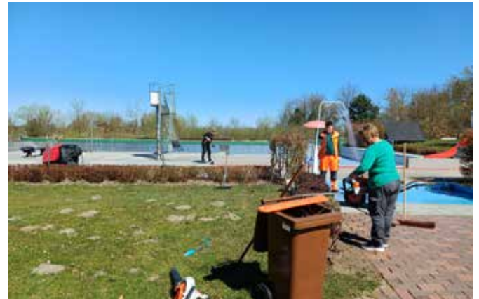
Die Vorbereitungen für die Sommersaison laufen.