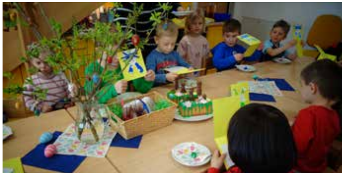
Am festlich gedeckten Tisch genießen wir gemeinsam das Osterfrühstück.