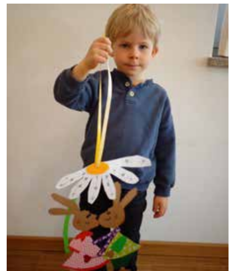
Ist das nicht schön?