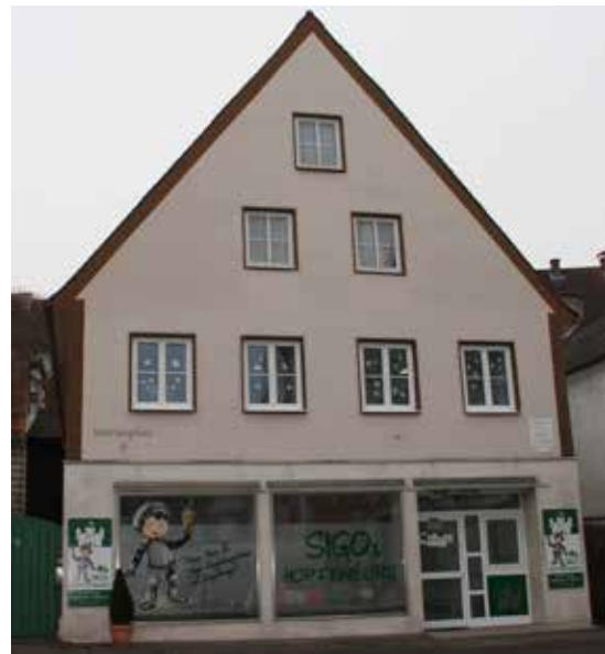
Das erste Treffen mit der Arbeitsgruppe Gollerhaus wird noch im April stattfinden.

Das Gremium stimmte der Planung jedoch nicht abschließend zu. Im Rahmen eines Arbeitskreises soll zusammen mit dem Architekten Naumann jun. die Planung diskutiert werden.