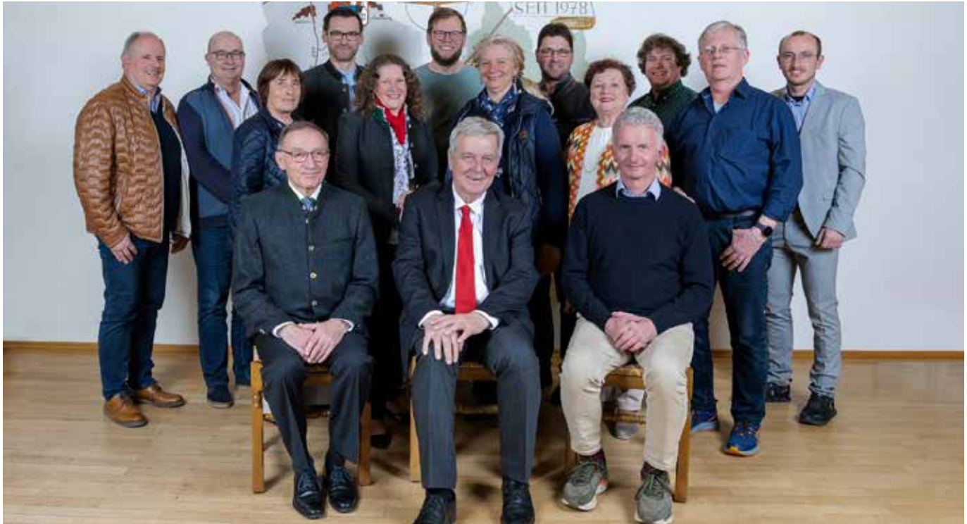
Gruppenbild der Marktgemeinderäte 2020-2026