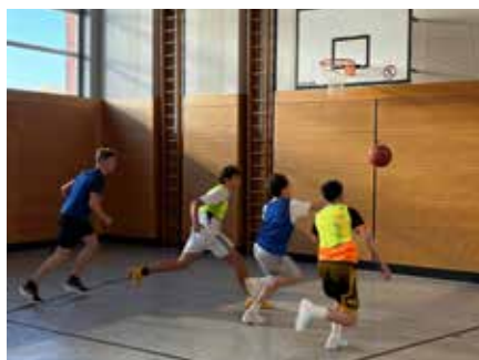
Kampf um den Ball