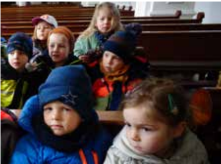
In der Kirche hören wir gespannt der Erzählung von Jesu Leidensweg zu.