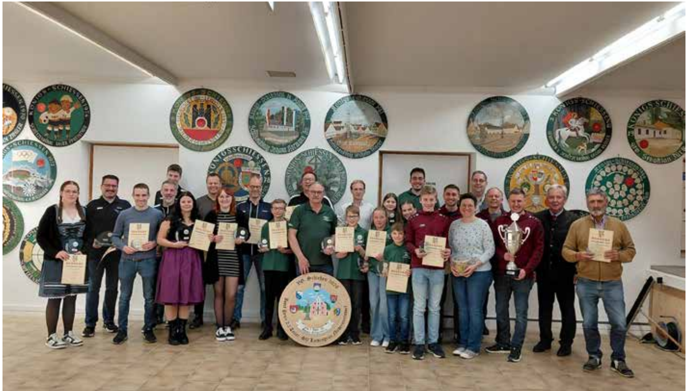
Preisträger VG Schießen 2026