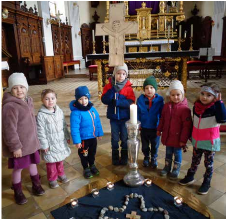
Das Kreuz ist Groß, das Kreuz ist schwer. Du nimmst es auf, wir danken Dir...