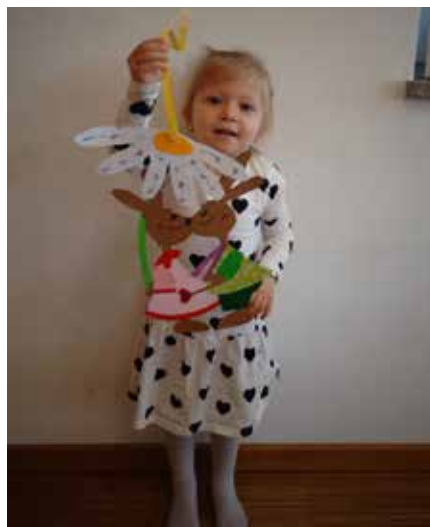
Auch für Mama und Papa hat der Osterhase ein Geschenk.