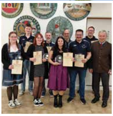
VFZ lud zum VG-Schießen

In dieser Ausgabe lesen Sie unter anderem: