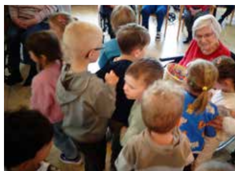
Danke für die Leckereien!