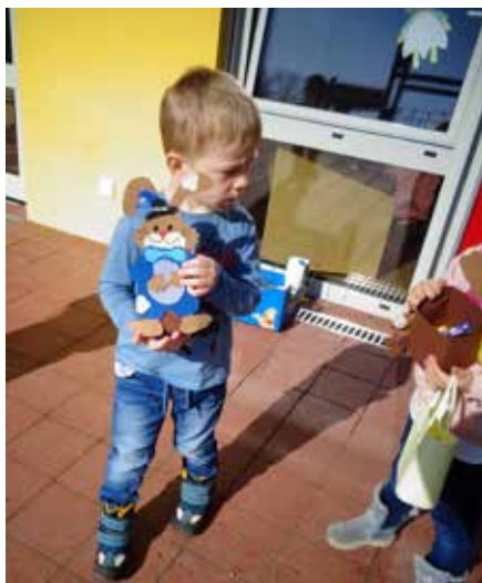
Der liebe Osterhase ist da!