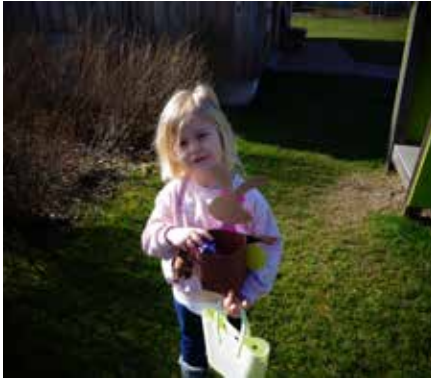
Endlich habe ich mein schönes Osternest entdeckt.