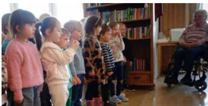
Eine Osterüberraschung für die Senioren - gemeinsames Singen von Osterliedern.