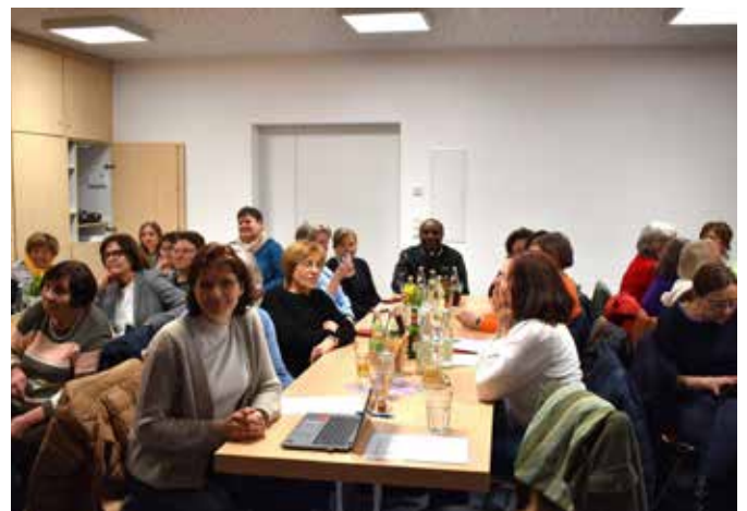
gebannt lauschte man dem Vortrag